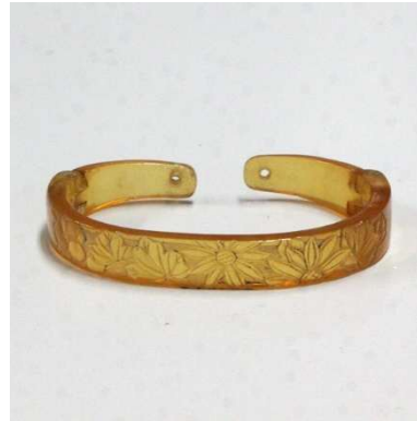
図 1-8-61 べっ甲根掛 菊図 白甲による上品な根掛。

したべっ甲の根掛。こうしたべっ甲根掛を好む女性も多かった。 図1-8-61はべっ甲（白甲）の根掛、図1-8-62は蒔絵螺鈿を施