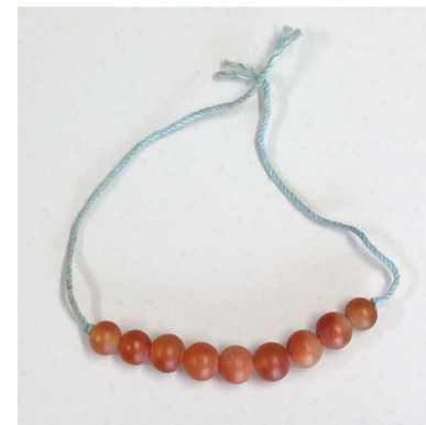
図 1-8-68 めのうの玉根掛