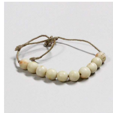
図1-8-70 白サンゴの根掛

庶民的な宝石である水晶の根掛(図1-8-71)、紫水晶(アメシ スト)の根掛(図1-8-72)も引き続き用いられた。