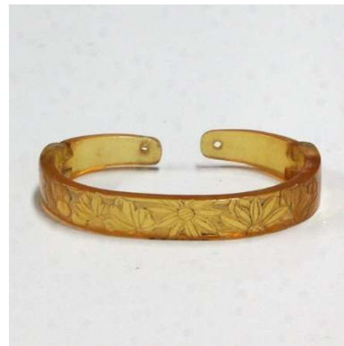
図1-8-66 べっ甲根掛 菊図 白甲による上品な根掛。

図1-8-66はべっ甲（白甲）の根掛、図1-8-67は蒔絵螺鈿を施したべっ甲の根掛。こうしたべっ甲根掛を好む女性も多かった。