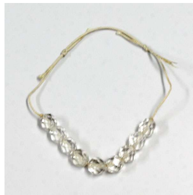
図1-8-66 水晶切子玉の根掛 涼しげな水晶は特に夏の根掛 として好まれた。

庶民的な宝石である水晶の根掛(図1-8-66)や紫水晶(アメシ スト)の根掛(図1-8-67)も明治末頃から引き続き用いられた。