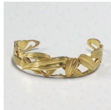
図 1-8-57 金透かし根掛 笹 図

図1-8-57は実物の金根掛。大切に保存されていたようでほとんど使った形跡がない。このように潰されずに残っている金根掛はあまりない。