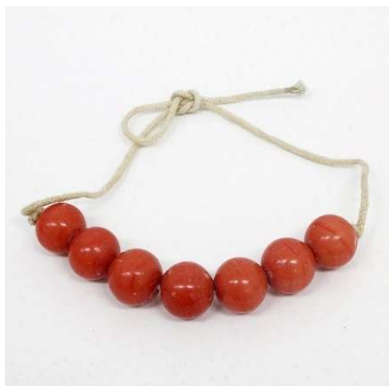
図 1-8-70 セルロイド模造サンゴの根掛

以上の玉根掛は天然石だが、セルロイドやガラスの安価な模造サンゴ根掛も多い。またガラスの模造ヒスイの根掛も数多い。これらの模造石根掛はおそらく天然石の十倍以上作られていた。そのためか、現在、骨董市場で見られるサンゴ、ヒスイ根掛の十中八、九は模造品である。 図1-8-70はセルロイドの模造サンゴの根掛。明治期から作られているが大正期に入ると更に盛んに作られた。