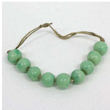
図 1-8-77 模造ヒスイの玉根掛（天然石 風）

図 1-8-78 は、小粒ビーズを編んで作ったモダンな根掛。 『櫛・かんざし』（田村コレクション） 66 ではこの種のビーズ根掛 の時代は幕末〜明治時代のもつとされているが、もう少し後の時代 のもののように思える。ここでは大正前期頃のものとして紹介する。