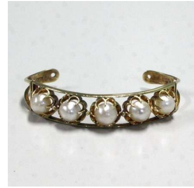
図 1-8-60 金に半円真珠入り根掛

したべっ甲の根掛。こうしたべっ甲根掛を好む女性も多かった。 図1-8-61はべっ甲（白甲）の根掛、図1-8-62は蒔絵螺鈿を施