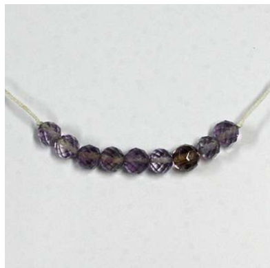
図1-8-67 紫水晶(アメシスト)切子玉 の根掛 大正前期末以降のもの。

その他、明治期以来のめのう(図1-8-68)や孔雀石(マラカイト) (図1-8-69)の玉根掛を好む女性も少なくなかった。