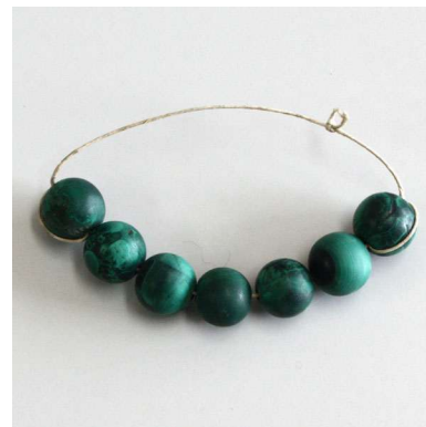
図 1-8-69 孔雀石（マラカイト）の玉根掛

以上の玉根掛は天然石だが、セルロイドやガラスの安価な模造サンゴ根掛も多い。またガラスの模造ヒスイの根掛も数多い。これらの模造石根掛はおそらく天然石の十倍以上作られていた。そのためか、現在、骨董市場で見られるサンゴ、ヒスイ根掛の十中八、九は模造品である。 図1-8-70はセルロイドの模造サンゴの根掛。明治期から作られているが大正期に入ると更に盛んに作られた。