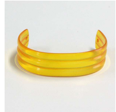
図 1-8-63 セルロイドの根掛 一見すると白べっ甲（白甲） の根掛に見える。