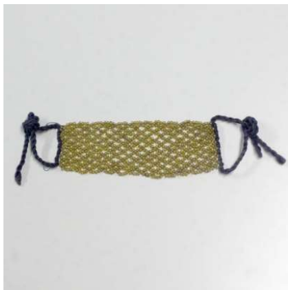
図 1-8-78 小粒ビーズ組み合わせ根掛

図 1-8-78 は、小粒ビーズを編んで作ったモダンな根掛。 『櫛・かんざし』（田村コレクション） 66 ではこの種のビーズ根掛 の時代は幕末〜明治時代のもつとされているが、もう少し後の時代 のもののように思える。ここでは大正前期頃のものとして紹介する。