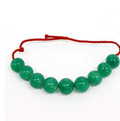
図 1-8-71 模造ヒスイの玉根掛（琅玕風）

造ヒスイを使った琅玕風根掛。 ろうかん 図 1-8-72 もガラスだが、こちらは 巧妙に作られていて天然の中級品ヒスイと見紛うほど。