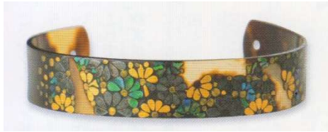
図 1-8-62 べっ甲蒔絵螺鈿根掛 菊図

として普及した。 図1-8-63は白甲を模したセルロイドの根掛。安価な大衆用根掛