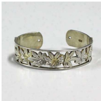
図 1-8-58 銀透かし根掛 かえで 楓 図