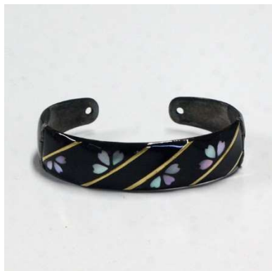
図 1-8-64 銀に金線と螺鈿根掛 桜図