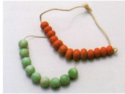
図 1-8-69 サンゴ（上）とヒスイ（下）の根掛

ただし大正前期には、サンゴは血赤系よりも桃色系のものが増え、根掛にも用いられた。ヒスイは簪の玉には琅玕質のものもあったが、根掛用のものは、以前と同じく白地に緑色が交ったものが一般的だった。