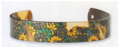
図1-8-67 べっ甲蒔絵螺鈿根掛 菊図