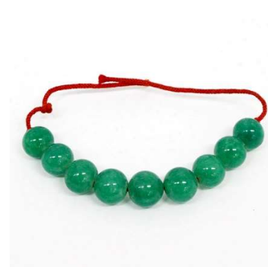
図 1-8-76 模造ヒスイの玉根掛（琅玕風）