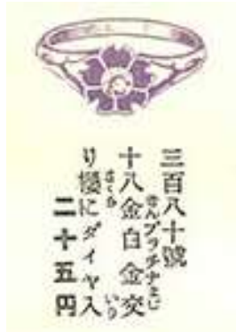
図 1-2-17 花モチーフの指輪 右上から菊形、桔梗形、撫子形、桜形 大正 2 年頃、三越呉服店『指輪時計埴物目録』 (みつこしタイムス第 11 巻第 9 号付録—臨時増刊) より