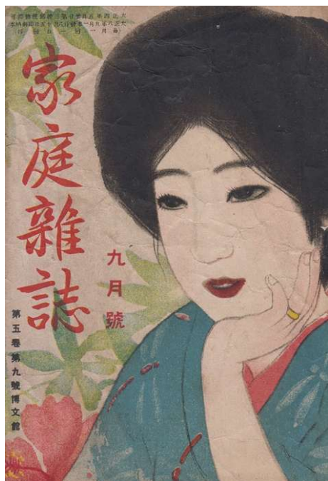
図 1-2-11 大正 8 年 9 月『家庭雑誌』表紙 結婚指輪らしき金指輪をした婦人。

そのことを示すのが大正二年、前項の三越の「12ヶ月指輪」と同時期に『女学世界』に出た甲丸 かまぼこ （当時は蒲鉾形と呼ばれた）の金製結婚指輪広告である（図 1-2-12）。