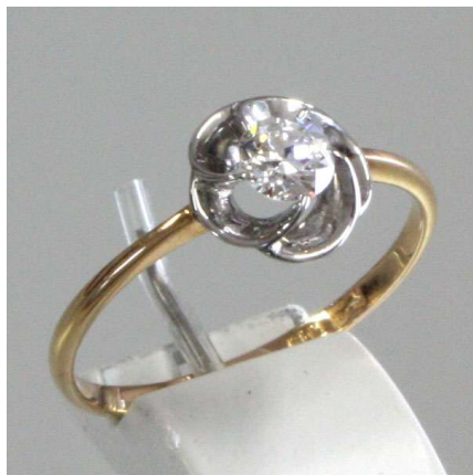
図 1-2-16 ねじ梅指輪（実物）