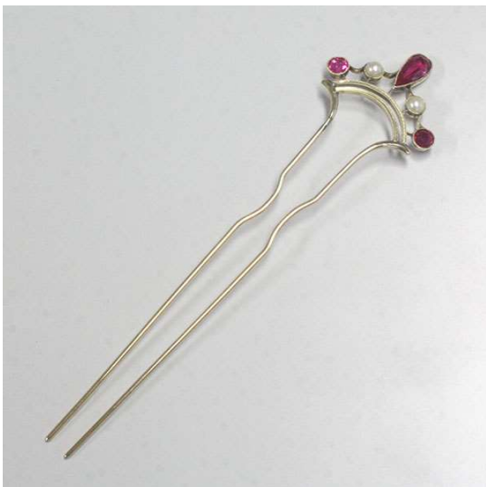
図 1-2-10 合成ルビーの束髪簪 金、真珠