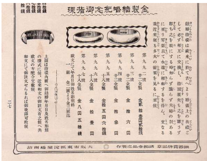
図1-2-13 金製結婚紀念御指環 尚美堂 大正2年1月『尚美堂新品録』より

店で、創業当時から時計だけでなく、貴金属や装身具、美術工芸品などを取り扱った宝飾専門店『JEWELS』 ⑮ 。早くも大正元年にはダイヤモンド専門の小冊子を発行するなどして大正時代の貴金属宝飾界のリーダー的宝飾店として名を馳せた。 この尚美堂が大正二年に出した商品カタログには金製の結婚指輪が紹介されていて、男性が女性に贈るだけでなく、西洋式に「必ず相互に交換」することを勧めている(図1-2-13)。