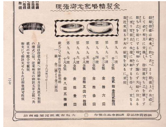
図 1-2-13 「金製結婚紀念御指環」 尚美堂 大正 2 年 1 月 『尚美堂新品録』より