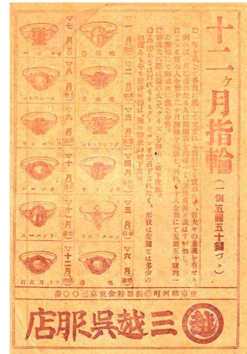
図 1-2-9 三越呉服店「十二ヶ月指輪」広告 大正2年5月『女学世界』 見にくいですが、右上から1月—柘榴石、 2月—紫水晶、3月—ブラッドストーン、 4月—※ダイヤ、5月—※エメラルド、 6月—瑪瑙、7月—※ルビー、8月— ムーンストーン、9月—※サファイヤ、 10月—オパール、11月—トパーズ、 12月—※土耳其石。