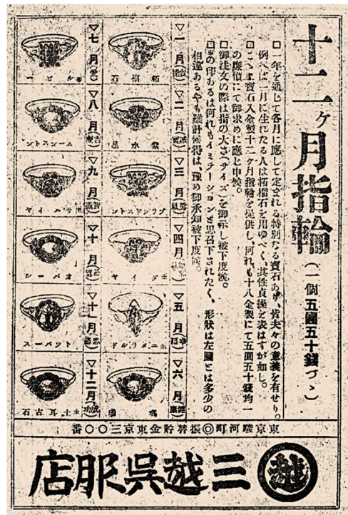
図1-2-9 三越呉服店「十二月指輪」広告 大正2年5月『女学世界』より 右上から1月－柘榴石、2月－紫水晶、 3月－ブラッドストーン、4月－※ダイヤ、 5月－※エメラルド、6月－瑪瑙、 7月－※ルビー、8月－ムーンストーン、 9月－※サファイア、10月－オパール、 11月－トパーズ、12月－※土耳其石（トルコ石）。

なお、御木本真珠店は天然の誕生石を扱ったのが早かったようで、同店の大正五年12月の『真珠』No.22で、6月の誕生石は真珠または月長石（ムーンストーン）であり、8月の誕生石は紅縞瑪瑙（サードオニックス）または橄欖石であるとし、裸石（ルース）をカラーで紹介している（ただし、12月はめのう、トルコ石となっており、ラピスラズリは見えない）。